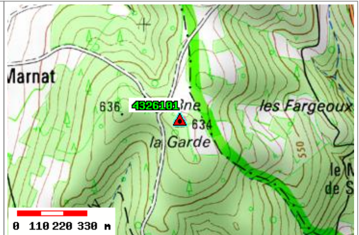
Carte : 2633 SAINT-GERMAIN-LEMBRON